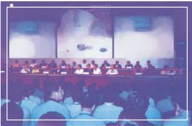
Reunión ministerial. 42 ministros de los 21 países miembros de APEC

El CENAM participó en este evento con 5 personas como Liaison Officers (Oficiales de Enlace), los cuales estuvieron en contacto directo con los ministros y líderes económicos para facilitar la comunicación entre las delegaciones y el Comité Organizador de APEC.